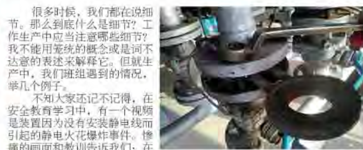
（图为操作人员正在更换不规范的静电跨接线）

很多时候，我们都在说细节。那么到底什么是细节？工作中应当注意哪些细节？我不能用笼统的概念或是词不达意的表述来解释它。但就生产中，我们班组遇到的情况，举几个例子。