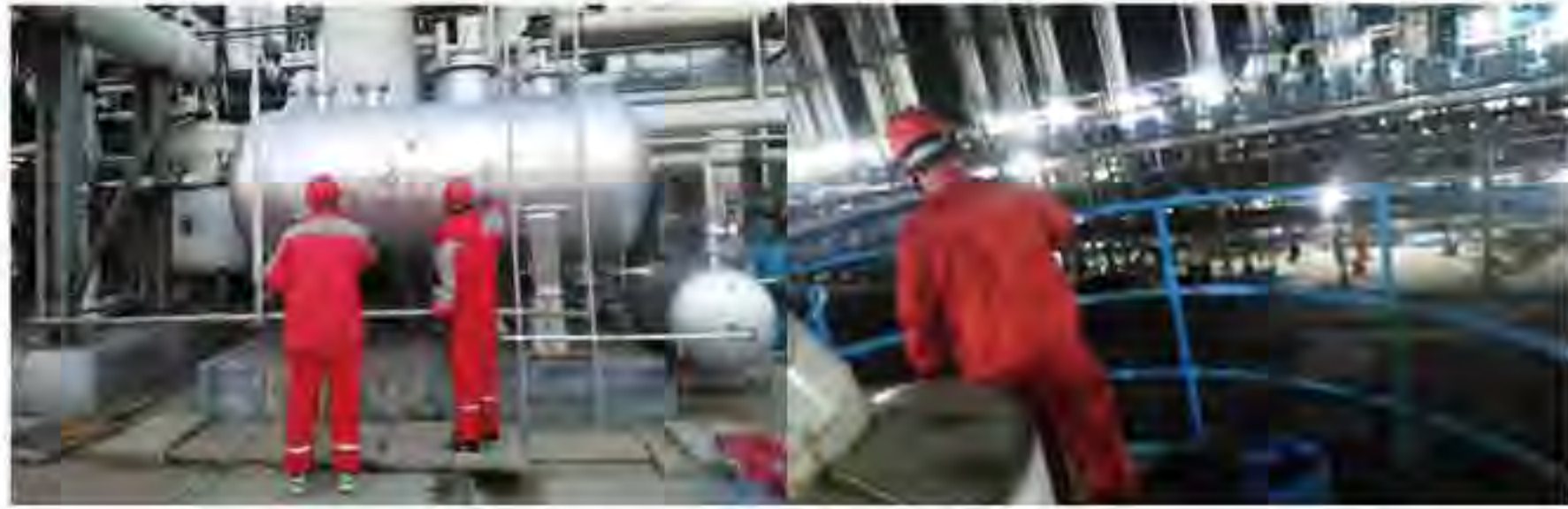
（图1为车间外操正在涂刷装置储罐）