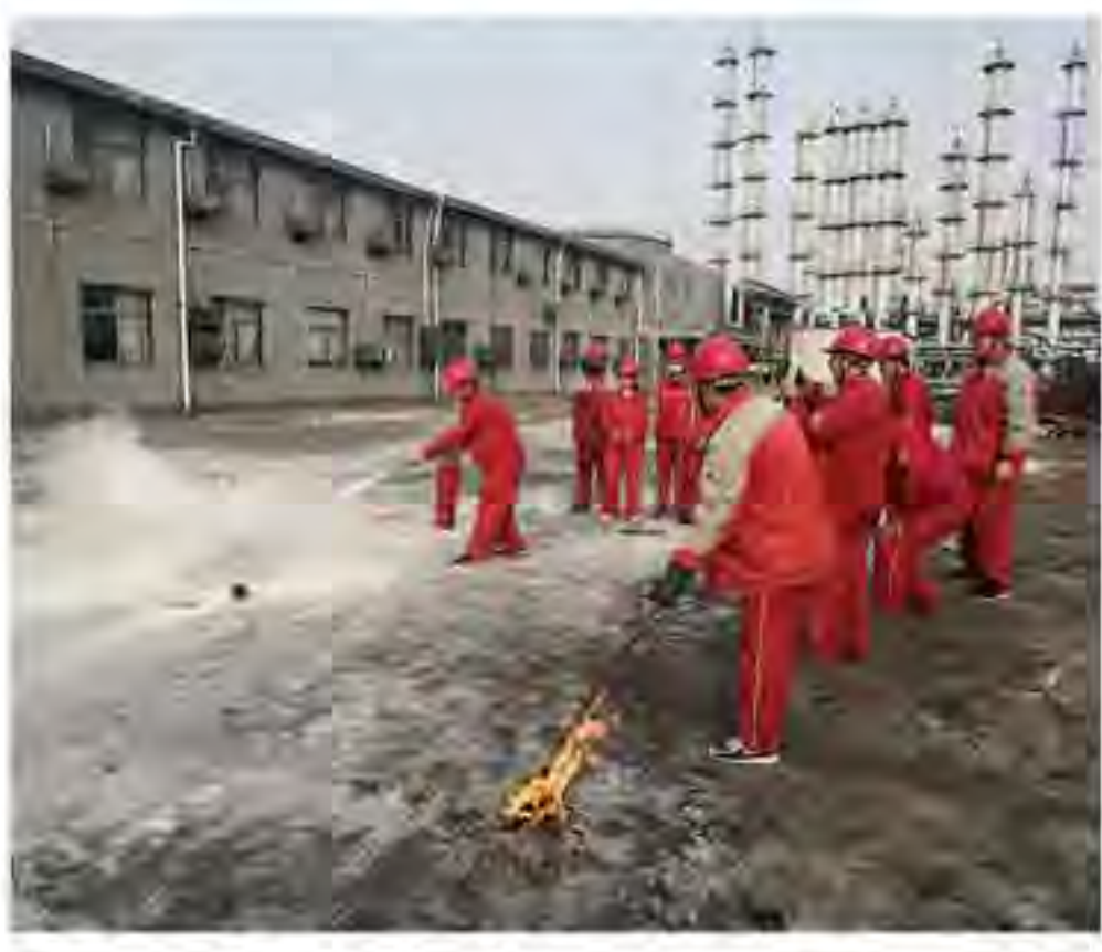
（图为生产运行中心丁班正在进行灭火器实操培训）

为了进一步强化公司员工的消防安全教育，提高火灾防控能力和突发事件应变能力，督促员工正确使用灭火器和各类消防器材、设备、设施等，近期，车间领导在安委会的指导下，组织生产车间在水房空地前开展了一次使用灭火器实战消防演习。